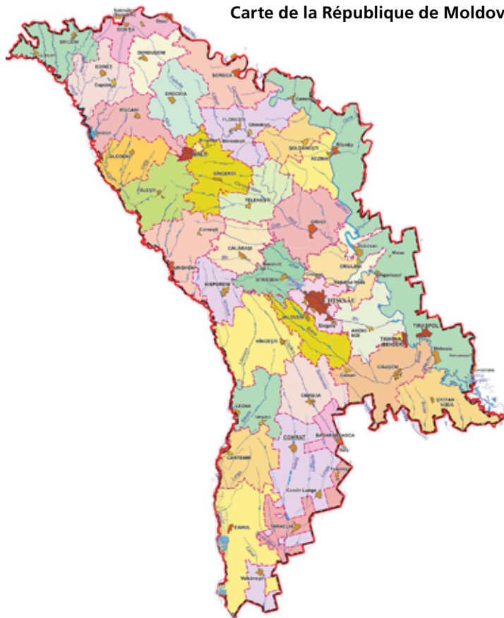
Carte de la République de Moldova